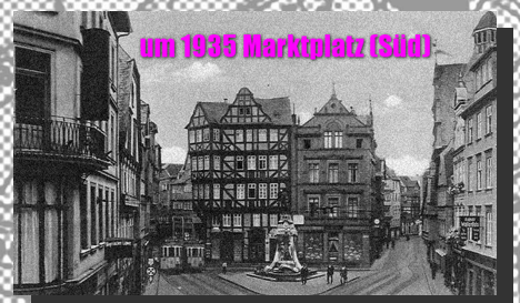
um 1935 Marktplatz (Süd)

Das digitale Abbild der Stadt Gießen im Mesh-Format basiert auf Daten der Luftbildbefliegung im März 2020 durch das Vermessungsamt Gießen. Juli 2023/Februar 2024 · www.GI35390.match-cut.de · mail.agb@web.de