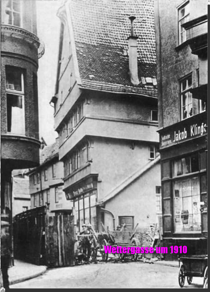
Wettergasse um 1910